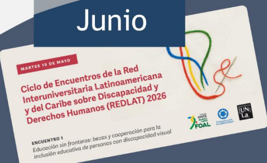
Primer Encuentro del Ciclo REDLAT 2026