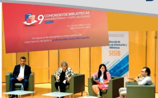
Panel "Las bibliotecas universitarias y su rol en la accesibilidad universal". Universidad de Chile Enero, 2023