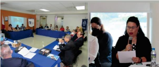
Creación de la Red de Universidades Inclusivas de Panamá -REUNIPA | Diciembre, 2022